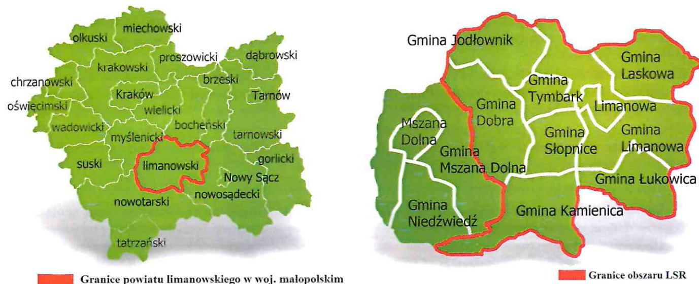
Rysunek 1 Mapy obszaru objętego LSR LGD „Przyjazna Ziemia Limanowska”