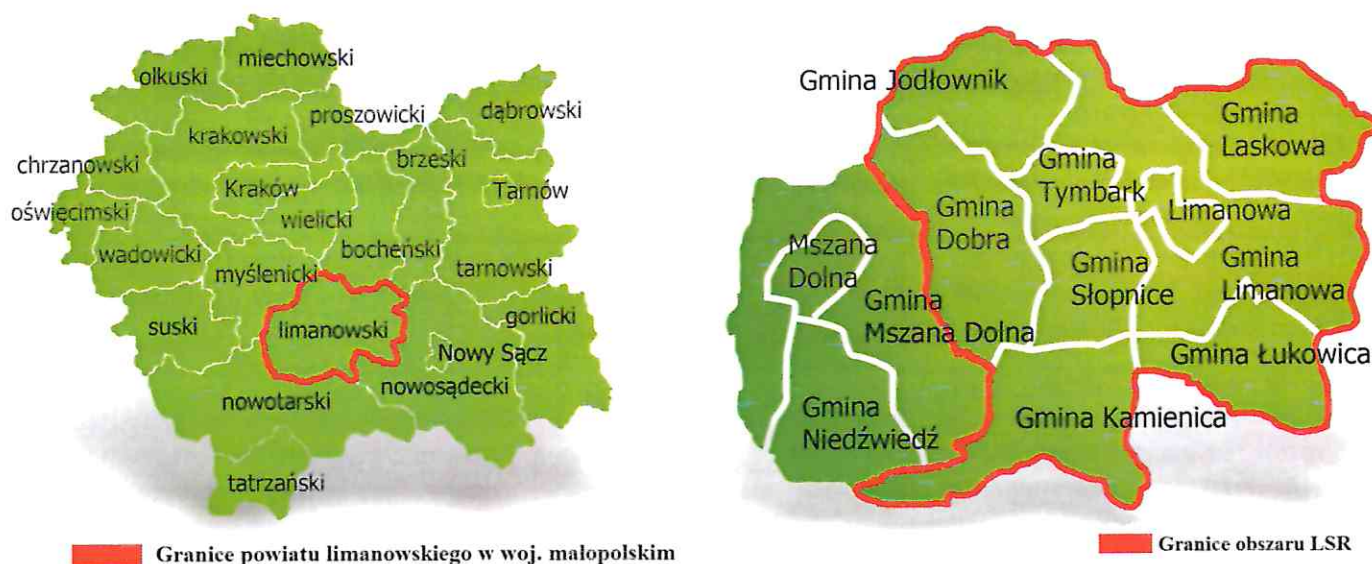
Rysunek 1 Mapy obszaru objętego LSR LGD „Przyjazna Ziemia Limanowska”