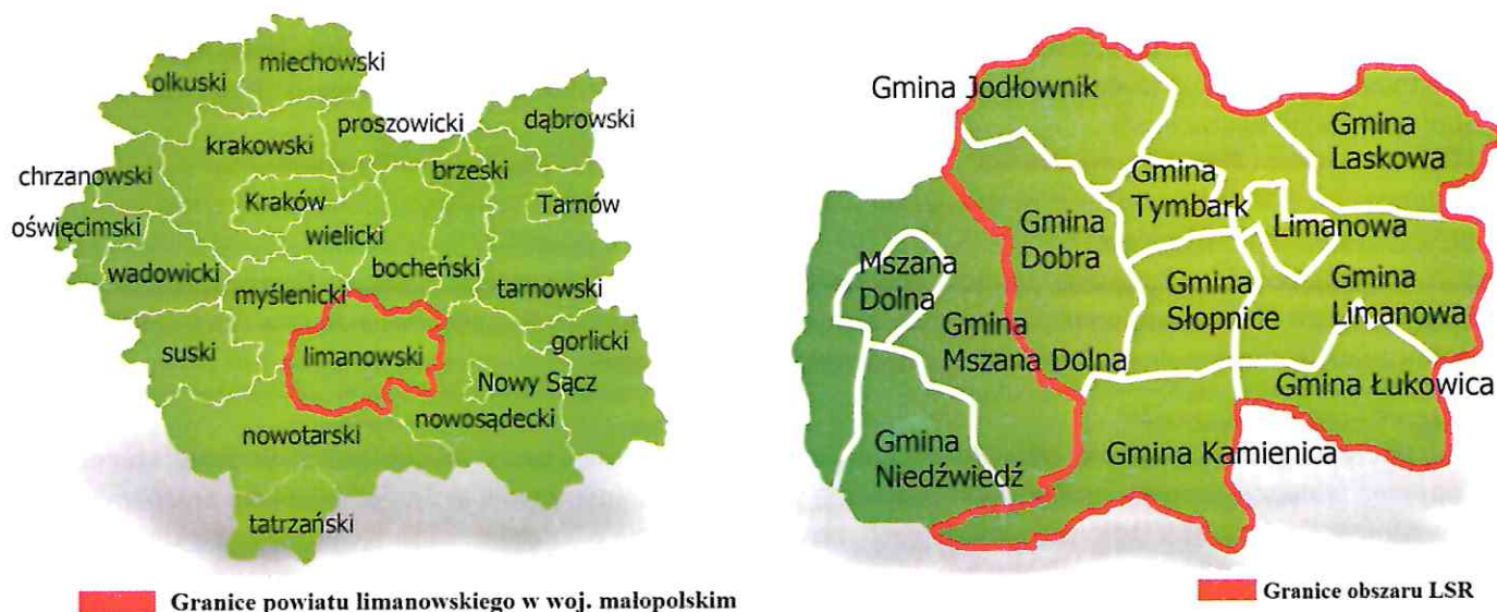
Rysunek 1 Mapy obszaru objętego LSR LGD „Przyjazna Ziemia Limanowska”