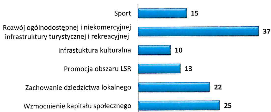
Wykres 2 Liczba fiszek projektowych złożonych przez potencjalnych beneficjentów z podziałem na zakres tematyczny w ramach pozostałych projektów (innych niż z zakresu przedsiębiorczości)